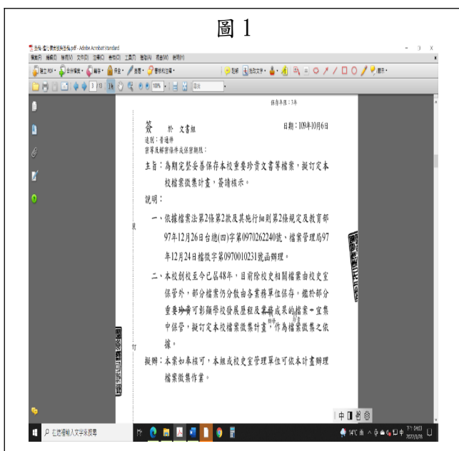
本校檔案徵集計畫簽呈