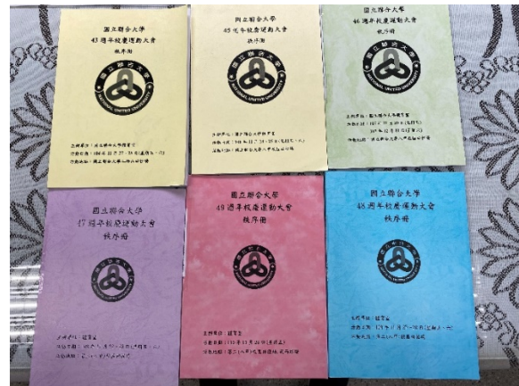
本校徵集成果 43、45-49週年校慶運動大會秩序冊